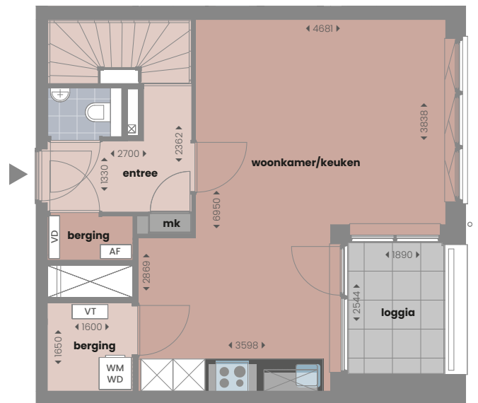
1 e verdieping